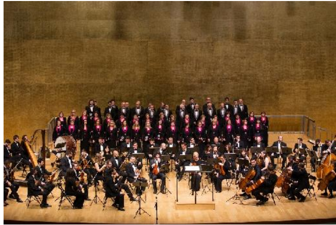
CONCIERTO "ALICANTINOS EN LA LÍRICA" (ADDA- 2015)

Con el nombre de Orfeón Crevillentino se funda en Crevillent (Alicante) en 1891 un coro de voces graves que, al finalizar la Guerra Civil española, se reorganiza transformándose en coro mixto y adopta la denominación actual de Coral Crevillentina.