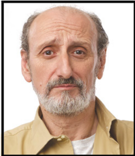
José Luis Gil